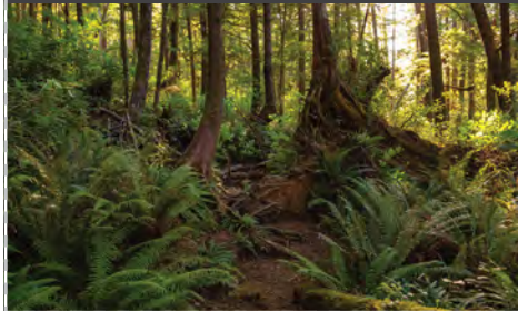
ME ARRASTRO, SALTO, CAMINO O CORRO