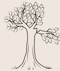
Ramas rotas colgando