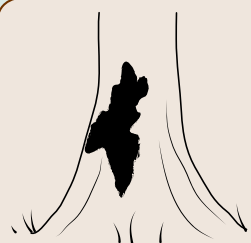
Manchas de podredumbre