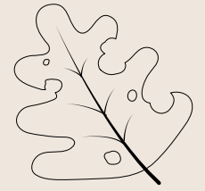
Presencia de insectos Pocas hojas u hojas llenas de agujeros