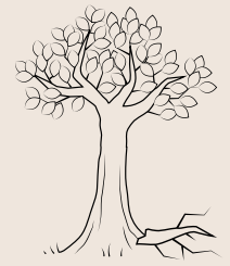
Ramas rotas en el suelo