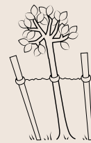
Problemas con las estacas Estacas dobladas, alambres sueltos, árbol desamarrado